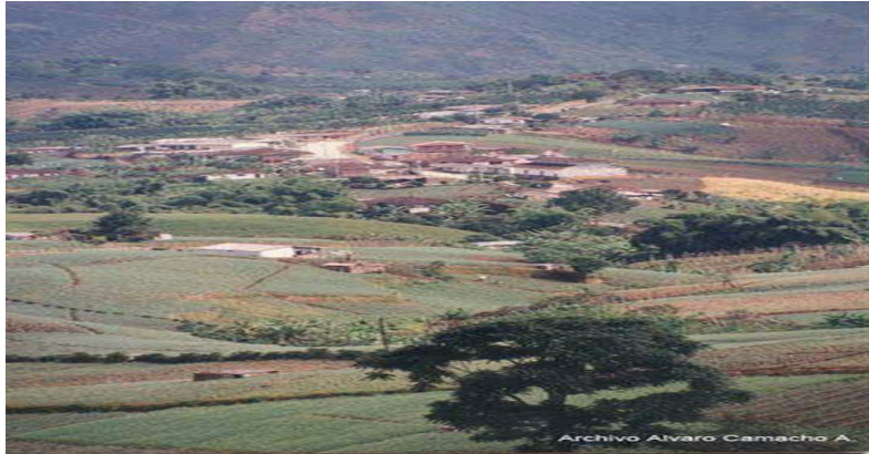
Figura 5. Panorámica del centro poblado de la bella década 1980. Se observan en la parte inferior los cultivos de cebolla en la vereda La Colonia