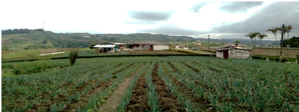
Figura 2. Panorámica de la extensión de La Hacienda vista desde La Bella

[...] Este inmueble es parte de mayor extensión que Bernardo Santacoloma de los Ríos adquirió en permuta con Lisímaco Gutiérrez Mejía, según consta en escritura N°1.383 de 16 de septiembre de 1953 de la notaría tercera de Armenia 7 .