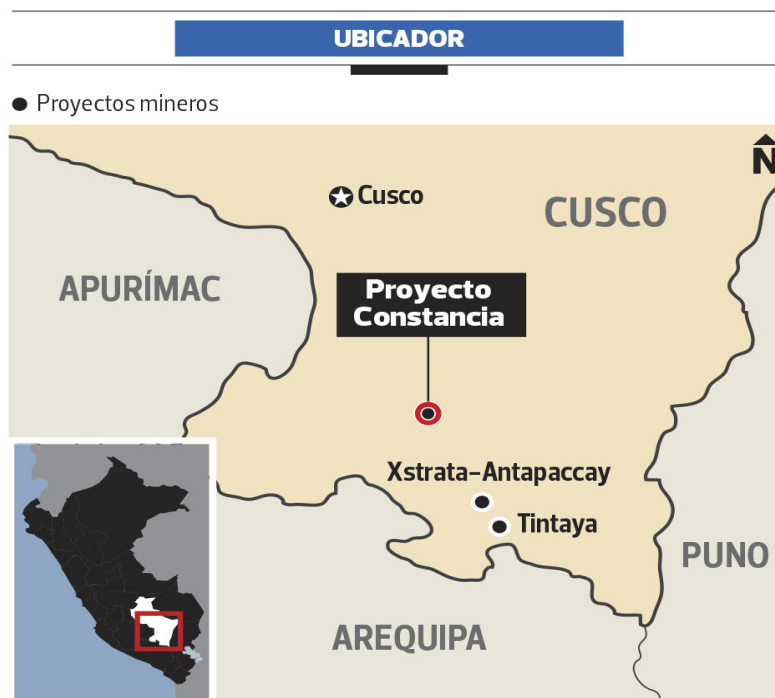
Figura 4. Mapa Geográfico – Mina Constancia y Antapaccay en la Región Cusco