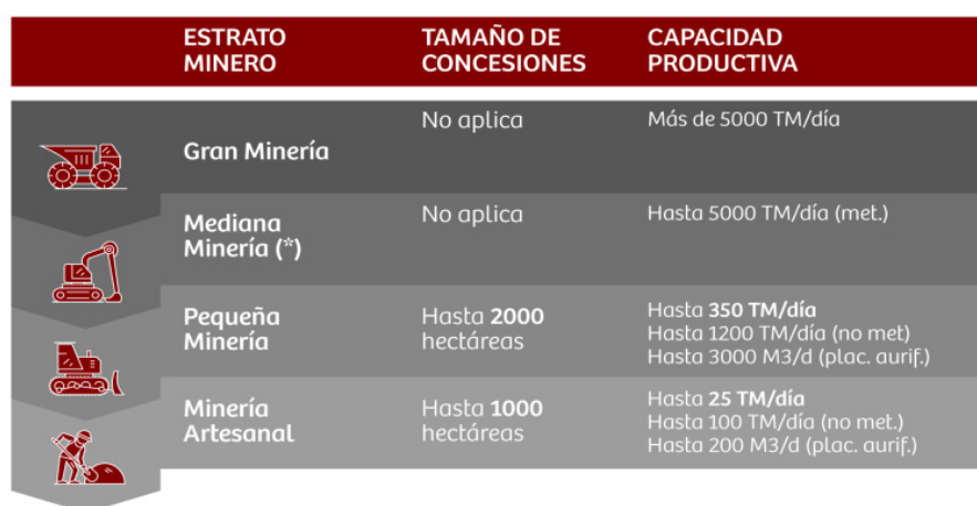
Figura 1. Clasificación de la industria minera en Perú