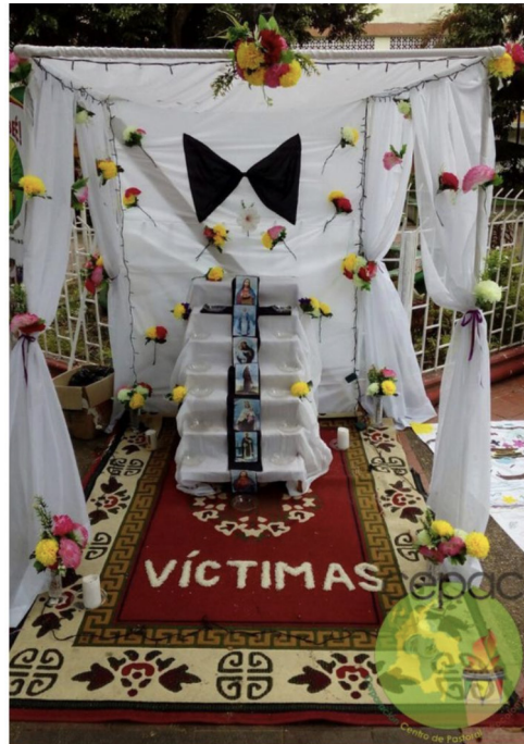
Figura 6. Rituales mortuorios, montaje de la tumba