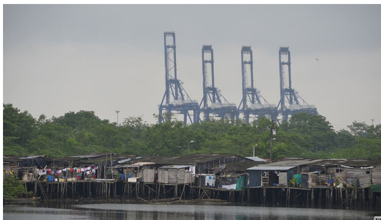
Figura 2. «Todo pasa por acá, pero no queda nada»