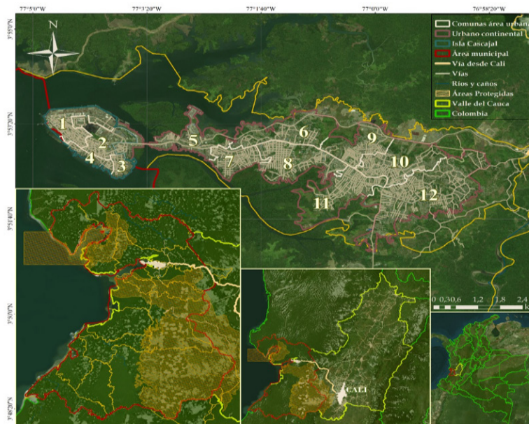
Figura 3. Mapa de Buenaventura