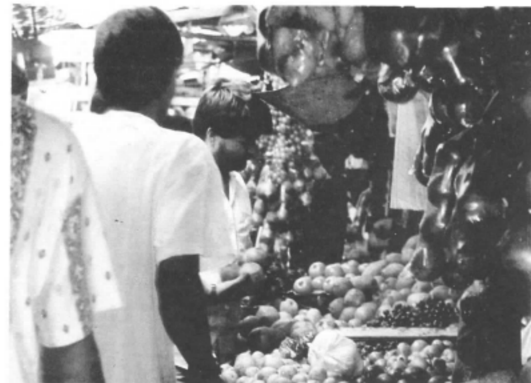
Puesto del exterior. Venta de frutas

Se ha saturado el espacio de tantos "Negocios" que quien vaya a comprar, está