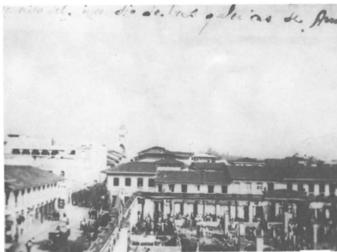
Incendio Galerías.