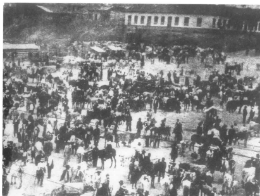
Plaza de Ferias. Aquí se construyó la actual Galería.

Hincapié y de los hermanos Giraldo entre otros.