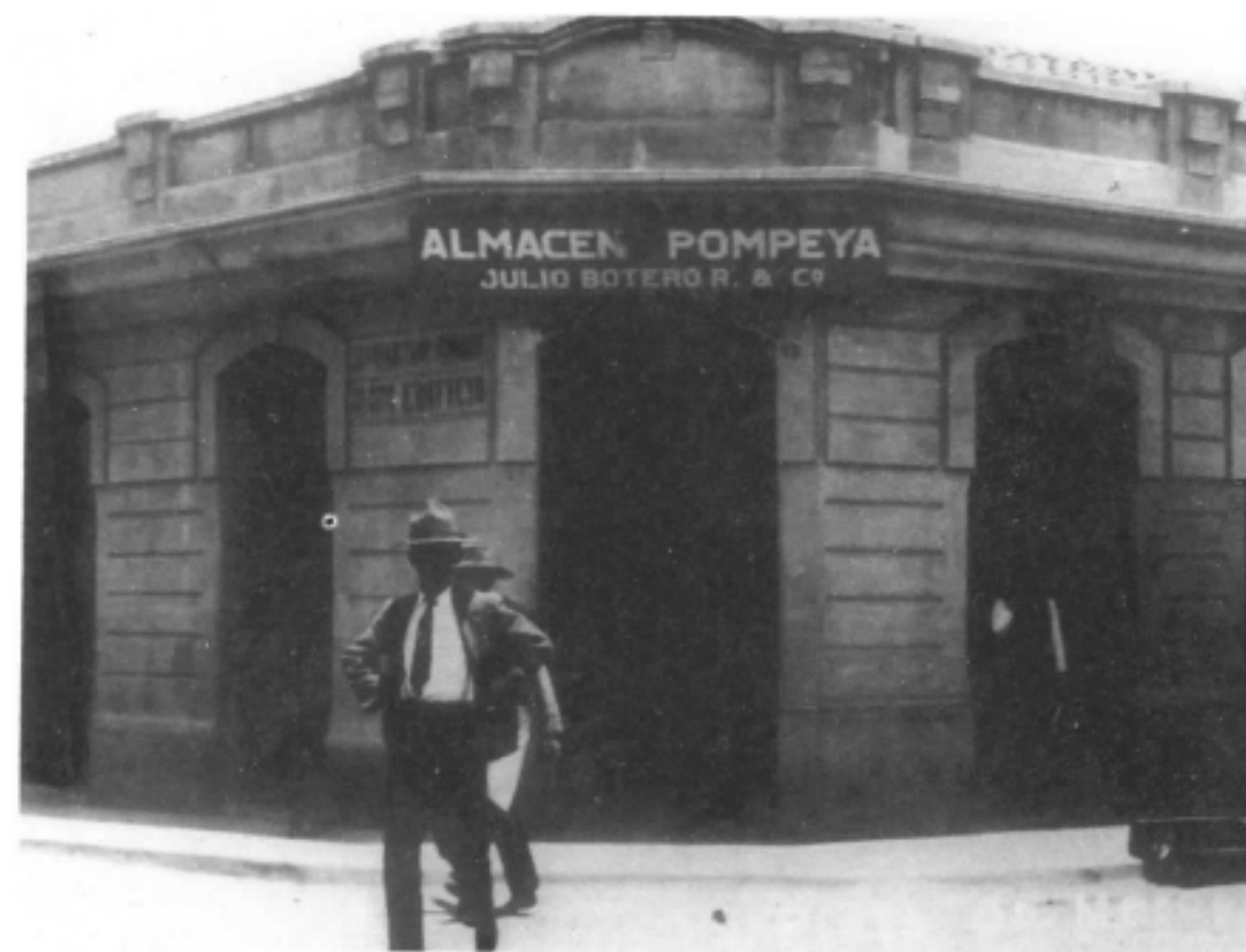
Galería Cervantes.