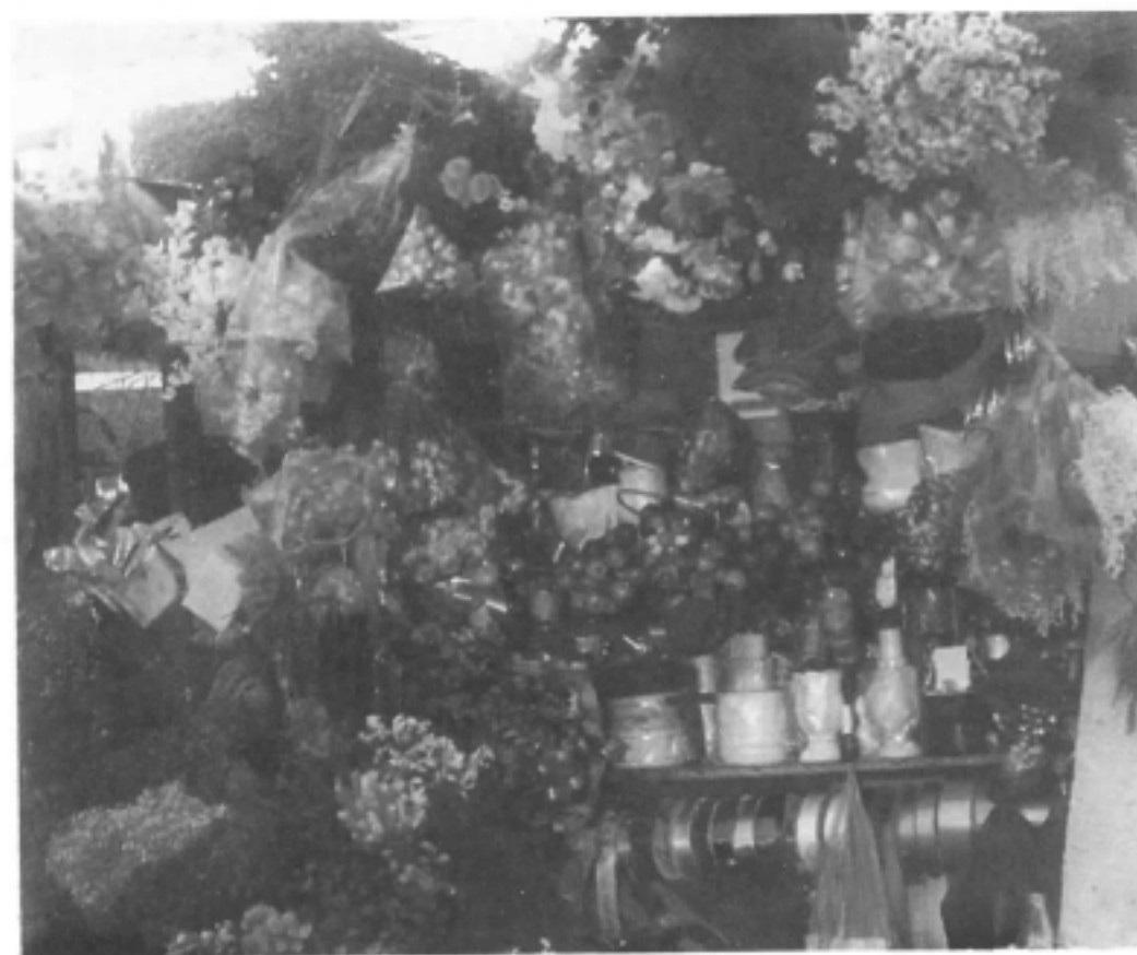
Puesto de flores. Puesto del interior

Los vendedores ambulantes siempre han merodeado la galería; a partir de los años 80 se presenta el fenómeno de la invasión agudizándose en 1992, originando una ruptura ostensible de las formas de urbanidad.