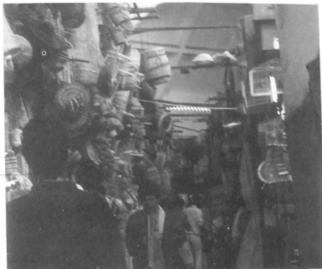
Pabellón de Artesanías, Ropa, Calzado.

alrededor una amplia calzada y bordeando ésta la zona de parqueo, tanto para propietarios como para usuarios.