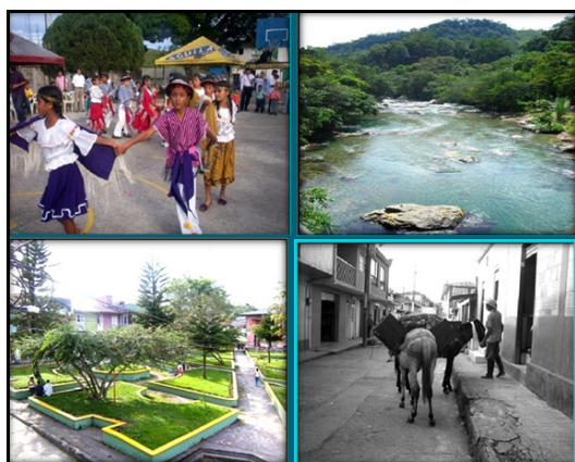
Fotografía 1. Dimensiones Ambientales del corregimiento

La investigación en el corregimiento de San Diego se fundamentó en la noción de Ambiente como alusión a las relaciones entre sociedad-naturaleza [4] y, por sobre todo, como un derecho social frente a las problemáticas ambientales que se derivan de un territorio con uno de los más dramáticos escenarios de lo que ha sido el conflicto colombiano y la vulnerabilidad social. Para efectos de su comprensión real en el territorio, en la investigación se apeló por estudiar lo ambiental a partir de tres Dimensiones : (1) Dimensión Ambiental Natural , (2) Dimensión Ambiental Cultural , (3) Dimensión Ambiental Humanizada (Fotografía 1). Tales dimensiones exigieron el reconocimiento y desarrollo de Sub-dimensiones Ambientales que permitieron identificar y analizar los problemas ambientales que configuran la problemática ambiental.