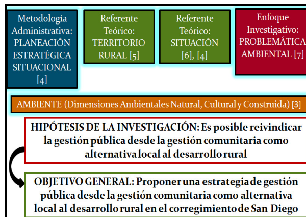
Figura 1. Estrategia de gestión pública desde la gestión comunitaria como alternativa local al desarrollo rural

La hipótesis: “ Es posible reivindicar la gestión pública desde la gestión comunitaria como alternativa local al desarrollo rural ”, motivó y guió el objetivo general de la investigación: Proponer una estrategia de gestión pública desde la gestión comunitaria como alternativa local al desarrollo rural en el corregimiento de San Diego ; a su vez, se fundamentó en tres hipótesis auxiliares que orientaron los tres objetivos específicos (Figura 1)