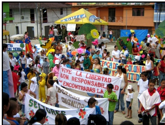
Fotografía 2. Festival por la Paz en el corregimiento de San Diego

De esta manera, aunque para algunos pobladores locales “San Diego sea al mejor lugar para vivir, para criar a los hijos y hasta para morir” (Fotografía 2), como lo alertó el maestro Orlando Fals Borda: “ De la mano del capitalismo desorbitado que importamos al ‘desarrollarnos’, hoy nuestros países se encuentran al borde del desierto ecológico y del infierno explosivo de la miseria de las mayorías. Además, el servilismo mimético resultante amenaza nuestras raíces históricas y culturales ” [14]