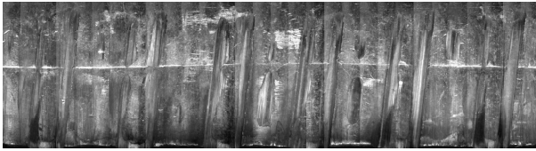
Figura 2. Superficie “desenvuelta” de un proyectil