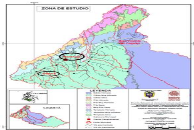
Fig. 1. Mapa climático del área de estudio (círculos negros) localizada en el Departamento del Caquetá (Colombia).