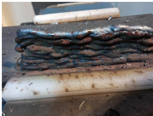
Fig. 2. Resultado de la aplicación inicial de once (11) capas sencillas.

once (11) capas se encontró que la poliamida no es el material adecuado porque la temperatura alcanzada en la aplicación completamente las mordazas, como se aprecia en la figura 2. La temperatura acumulada entre pases, además de deformar el sustrato, evitó una solidificación rápida del metal de soldadura en las capas más calientes y por tanto tendía a perder la forma del cordón de manera que la aplicación obtuvo una apariencia no uniforme, tal como lo muestra la figura 3.