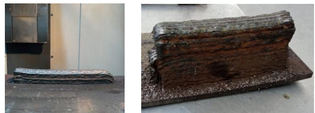
Fig. 7. Pared depositada para extraer probetas de tracción.

Para la deposición, se realizó en forma de una pared de longitud 220 mm, altura 115 mm y ancho 36 mm, utilizaron un caudal de CO 2 de 15 L/min, una distancia de la punta de contacto a la pieza de trabajo (CTWD) de 12 mm, velocidad de avance de 200 mm/min, tensión de salida de 24 V, velocidad de alimentación de 5 m/min. La pared depositada se presenta en la figura 7.