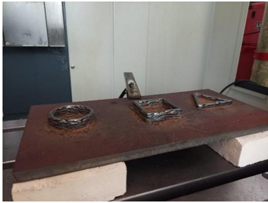
Fig. 4. Depósitos de pared sencilla como prueba de la conexión sincronizada entre CNC y máquina de soldadura.

También se retiró la mordaza de la mesa de trabajo del CNC, en su lugar se colocaron ladrillos refractarios para aislar térmica y eléctricamente el CNC del arco eléctrico. Para reducir la deformación del sustrato se cambió el espesor de 6,5 mm a uno de 20 mm y la temperatura entre capas se estableció que no sobrepasaría 150°C.