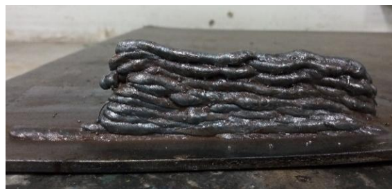
Fig. 3. Resultado de la aplicación inicial de once (11) capas sencillas.

Para automatizar el proceso, fue necesario sincronizar el movimiento del CNC con el inicio y fin de arco generado en la máquina de soldadura, para ello se realizó la conexión al CNC del gatillo de la antorcha y se creó el código para iniciar y finalizar el arco; este comando se incorporó al simulador generado por el software SprutCAM. Se probó la sincronización con depósitos de tres configuraciones geométricas diferentes como se aprecia en la figura 4.