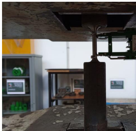
Fig. 10. Realización del ensayo de tracción.

Los ensayos, cuyo montaje se presenta en la figura 10, se realizaron en la máquina universal de ensayos SHIMADZU UH-500kN a una temperatura ambiente de 21°C. A partir de las curvas de carga-desplazamiento, se obtuvo la resistencia a la fluencia, la resistencia a la tracción y el porcentaje de elongación, las cuales fueron comparadas contra los valores esperados según la AWS A5.18.