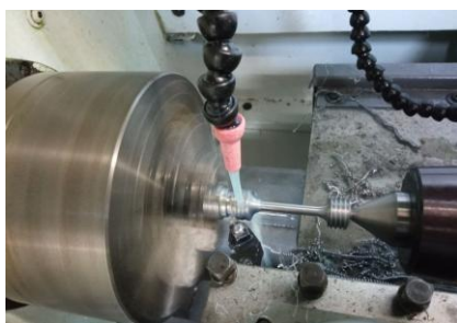
Fig. 9. Mecanizado de las probetas de tracción.

El mecanizado de las probetas de tracción se realizó de acuerdo con la figura 8 de la ASTM E8M-21: para las probetas horizontales se empleó la geometría de la probeta 2, mientras que las probetas verticales corresponden a la probeta 3. Se fabricaron dos probetas verticales y tres probetas horizontales utilizando un equipo Pinacho SE 200 x 750, como se aprecia en la figura 9.