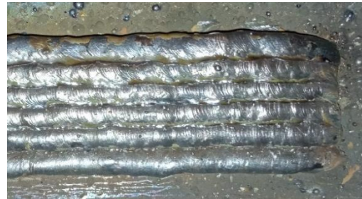
Fig. 6. Depósito para prueba de traslape entre cordones.

Posteriormente se probó el traslape entre cordones de cada capa, con un desplazamiento entre ejes de cordones de 2,6 mm el resultado mostró que había una tendencia a generar un perfil irregular, como se presenta en la figura 6. Se probó un traslape de 5,1 mm obteniendo una mejora notable en la apariencia de la capa.