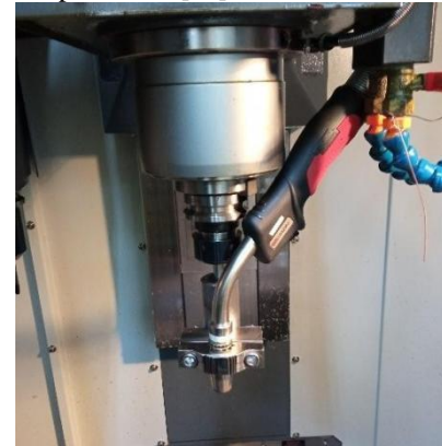
Fig. 1. Sistema de sujeción de la antorcha.

correspondiente a las trayectorias de deposición que debe seguir la antorcha en cada una de las capas de la pared se obtuvo empleando un simulador del proceso desarrollado en el software SprutCAM [20].