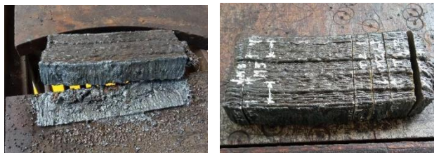
Fig. 8. Precorte de la pared depositada para extraer probetas de tracción.

El mecanizado de las probetas de tracción se realizó de acuerdo con la figura 8 de la ASTM E8M-21: para las probetas horizontales se empleó la geometría de la probeta 2, mientras que las probetas verticales corresponden a la probeta 3. Se fabricaron dos probetas verticales y tres probetas horizontales utilizando un equipo Pinacho SE 200 x 750, como se aprecia en la figura 9.