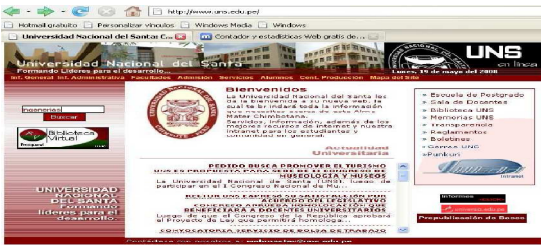
Figura 1. Universidad Nacional del Santa

Se realiza la evaluación de la universidad Nacional del Santa Dirección url ( http://www.uns.edu.pe )