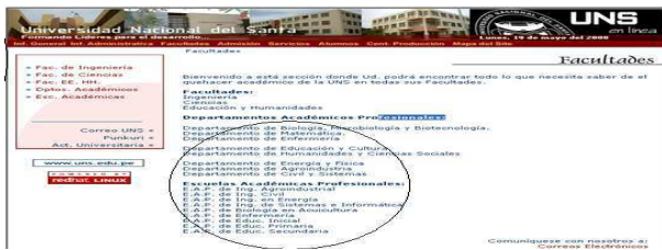
Figura 7. Programa de estudios

Las siguiente tabla, presentan un resumen de los resultados obtenidos para cada uno de los ítems evaluados.