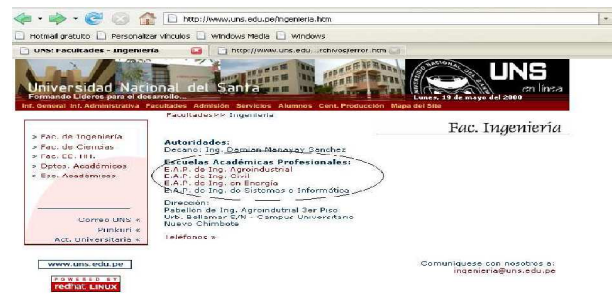
Figura 6. Hipertexto

Algunas de los hipertexto (enlaces), imágenes y figuras tienen textos alternativos. Es preocupante que en las hojas internas no poseen en los enlaces o elementos de menú internos, imágenes y figuras texto alternativo.