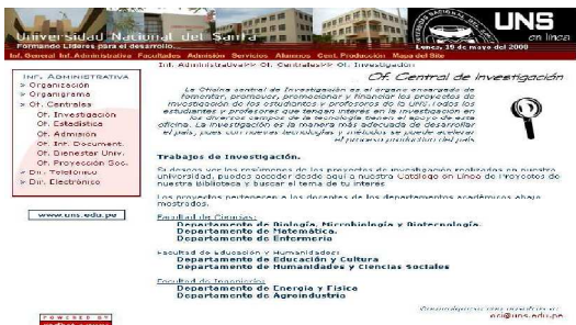
Figura 8. Programa de estudios

En la información de contacto no se incluye ninguna dirección de correo electrónico o fax, tampoco se incluyen el nombre de ninguna de las personas de contacto que responden a los teléfonos especificados.