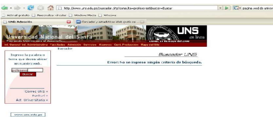
Figura 2. Buscador no funciona