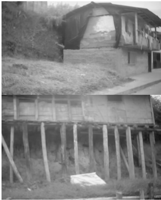
Fotos 1 y 2. Viviendas localizadas en la pata y corona de un talud.

La situación que se está presentando a la fecha en el sector de Esperanza Galicia, prospecta un potencial conflicto relacionado con el proceso de reubicación y de titulación de viviendas asociado a la temática del riesgo en el sector. La condición de riesgo de algunas viviendas valoradas es la limitante para acceder a la escritura pública y es, a su vez, la amenaza para que se genere un proceso de reubicación. Las expectativas generadas con la construcción de un macroproyecto como el Parque Temático de Flora y Fauna, si bien están relacionadas con el mejoramiento de las condiciones laborales, ponen en evidencia cierta dualidad con el mismo, puesto que algunos pobladores temen que esto signifique una valorización para los predios, con las consecuentes situaciones que esto generaría relacionadas con el pago de impuestos y el incremento en las tarifas de servicios públicos, que en contraste con las condiciones económicas y sociales de la mayoría de las familias que habitan el sector, se constituiría en un hecho desfavorable para ellos más no de solución a sus condiciones actuales de vida.