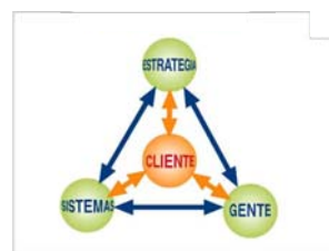
Figura 1. Triángulo del servicio

Permite concebir el servicio como un todo, que se encadena y que actúa alrededor del cliente, con relaciones entre la estrategia, la gente y el sistema. (Ver figura 1)