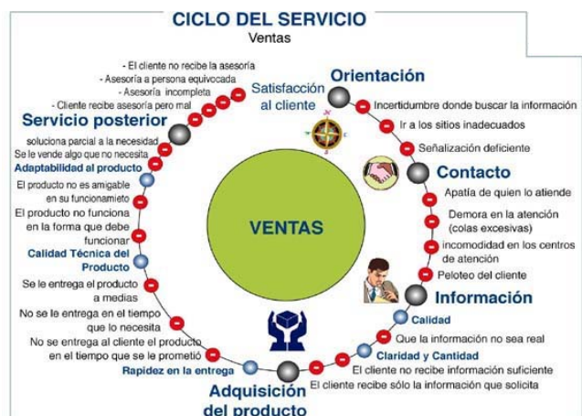
Figura 4. Ciclo del Servicio - Ventas