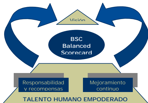
Figura 3: Balanced Scorecard. Cuadro balanceado de control

Así, las cuatro perspectivas del Balanced Scorecard pueden ser definidas como se presenta a continuación: