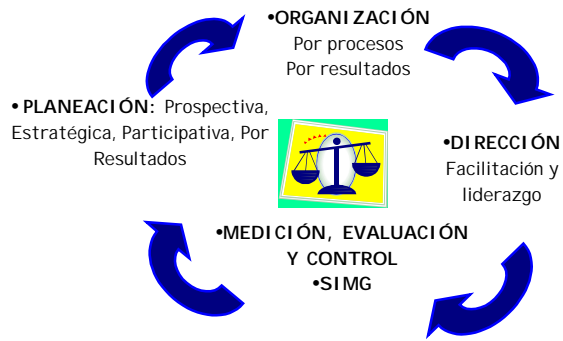
Figura 1. Componentes del Sistema

El Sistema Integral de Medición de la Gestión requiere de la Planeación , la cual debe ser diseñada dentro del análisis prospectivo y del direccionamiento estratégico, lo cual permite establecer que acciones se deben emprender desde el presente a fin de encontrarse en los escenarios óptimos en el futuro. Esta fase requiere altos niveles de participación del Talento Humano de tal manera que todas las etapas mencionadas permitan la definición de los resultados proyectados que se deben alcanzar en el largo plazo.