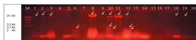
Figura 2. Bandas plasmídica observadas en las cepas 1: QB 3DB2 , 2: QB 3DB1 , 3: QB 3DA1 , 6: QB 2DB1 , 8: QB 3DA1 , 9: QB 2DA2 , 10: QB 2DA1 , 11: QB 2DB2 , 12: QB 2BB1 , 18: QB 1BB2 , 19: QB 1BA2 M: λ Hind III.

En relación a la determinación del perfil de bandas plasmídicas de las 25 cepas de S. aureus estudiadas, se puede mencionar que el 12% (3 cepas) mostró bandas de DNA plasmídico, cuyo tamaño fue de 23 kb Tabla 2, Figura 1. El 88% de cepas restantes [22 cepas] no mostraron bandas de ADN plasmídico.