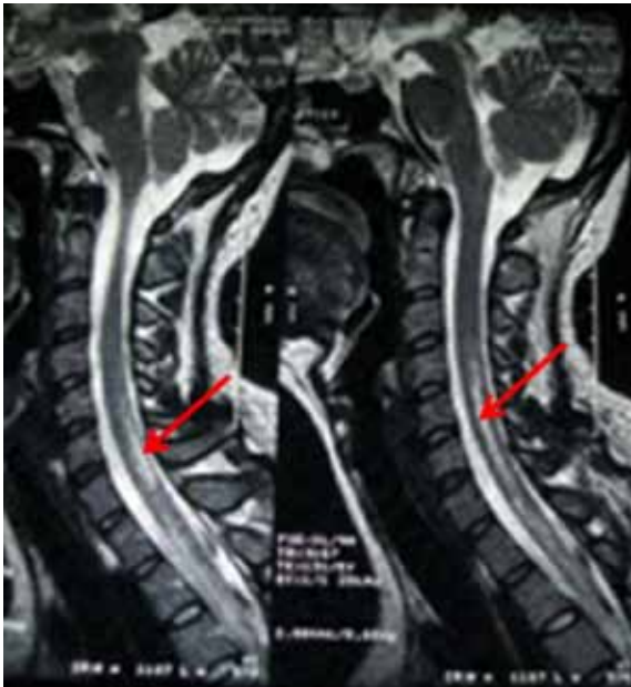
Figura 3. Resonancia magnética de médula espinal T1.