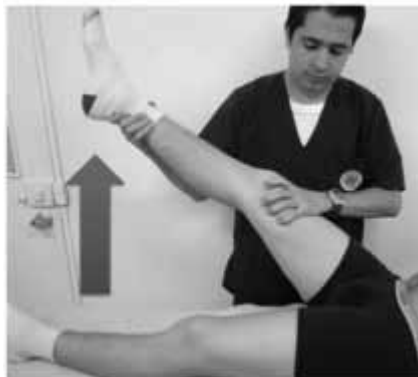
Figura 6. Maniobra de Lasègue para evaluar radiculopatías lumbosacras.

Signo de Lasègue: El paciente debe acostarse en la camilla y extender el miembro inferior que se va a evaluar; el examinador por su parte flexiona pasivamente la cadera del paciente entre 30° y 60° (idealmente 45°); si la persona manifiesta dolor en el miembro inferior que se irradia por debajo de la rodilla la prueba es positiva, pero si el dolor sólo se presenta en la cadera, la cintura, la región glútea o la pata de ganso, la prueba es negativa (3, 9). Cuando se realiza el Lasègue invertido, es decir, la misma maniobra pero en la pierna contraria al sitio del dolor, se aumenta la especificidad de la maniobra pero disminuye su sensibilidad (4, 23, 24, 50, 53, 60, 61).