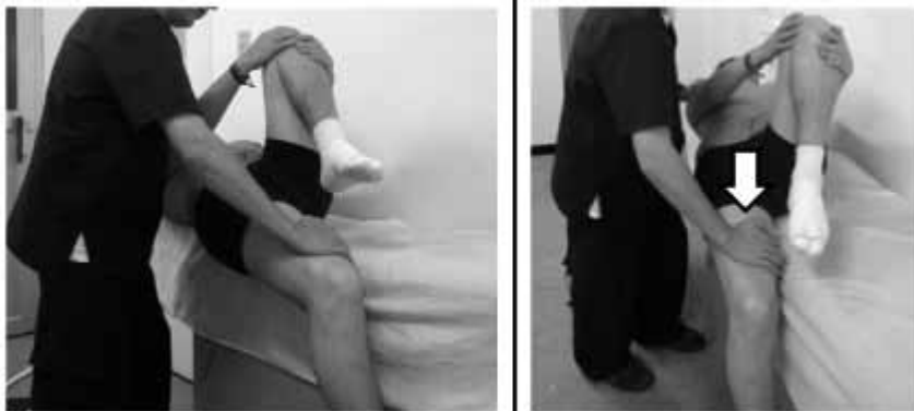
Figura 5. Maniobra de Gaenslen para evaluar dolor sacroilíaco.