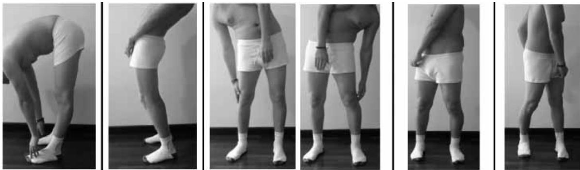
Figura 3. Maniobras que permiten evaluar integralmente los movimientos de la columna lumbar. Arriba) Flexión, extensión y flexión lateral. B) Flexión lateral y rotación.